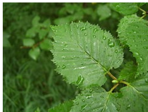
Detalle de la hoja